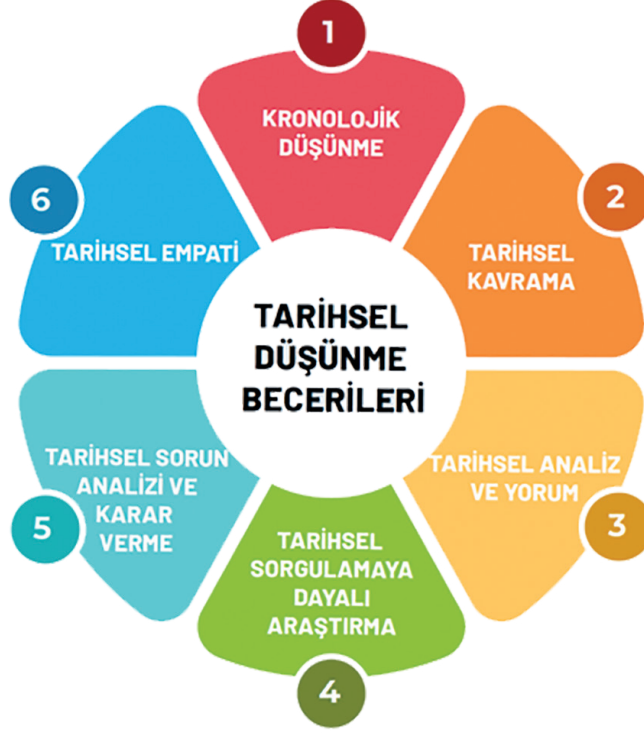
Şema 1: Tarihsel Düşünme Becerileri

ve karar verme ile tarihsel empati adlarıyla sekiz başlık altında detaylandırılmıştır. 2022 yılında güncellenen Ortaöğretim Tarih Dersi 9-11. Sınıflar Öğretim Programında ise öğrenme hedefleri, değer ve tutumlar, genel beceriler ve tarihsel düşünmenin anahtar kavramlarıyla birlikte öğrencilere kazandırılmak istenen tarihsel düşünme becerileri şunlardır: