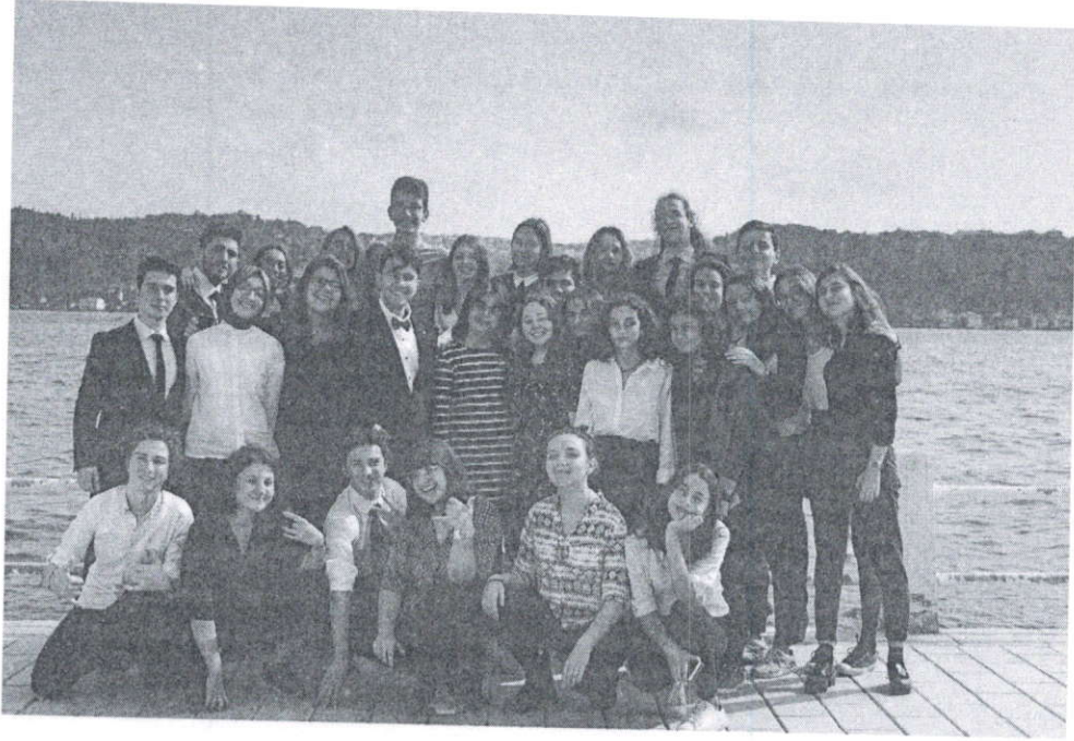
2019 yılı yönetim takımımız